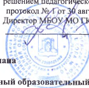
Таблица-сетка часов учебного плана МБОУ МО ГК СОШ № 10