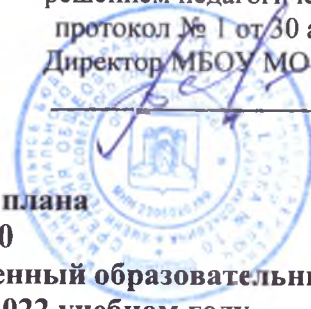
Таблица-сетка часов учебного плана МБОУ МО ГК СОШ № 10